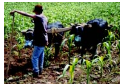
Preparación del suelo

Con frecuencia las plagas de insectos se acumulan en grandes poblaciones en ciertas especies de malezas de una plantación, en plantas voluntarias del cultivo o en hospederos silvestres, dentro o cerca del cultivo comercial. En cualquier cultivo se hace necesario la destrucción de estas plantas, para evitar la acumulación y migración de plagas.